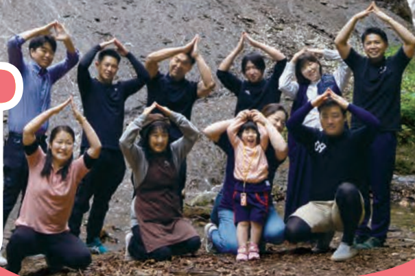
みくの滝にて撮影