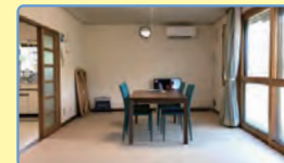
ペット(小動物)も同伴可能。