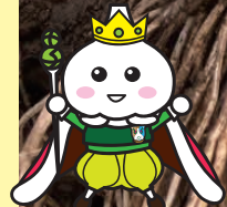
たっこんにんく イメージキャラクター たっこ王子

冬は適度に雪が積もる冷涼な地域で育つブランド「たっこんにんく®」は、白く大きい粒で甘味が強いのが特徴。