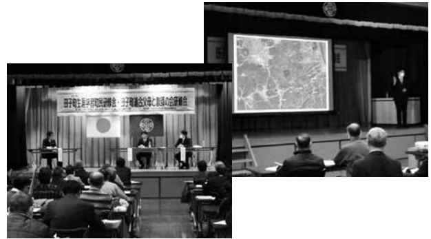
【令和2年度生涯学習町民研修会】 演題 「城づくりから見える南部氏の生き方について」 第一部 講演 第二部 トークセッション