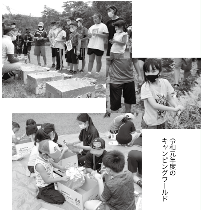
令和元年度の キャンピングワールド