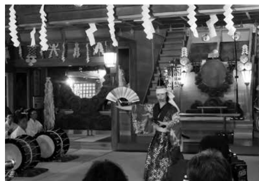
櫻山神社(盛岡市) 田子神楽奉納の様子