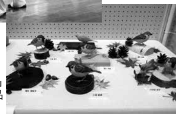
「バードカービング講座」受講生の作品