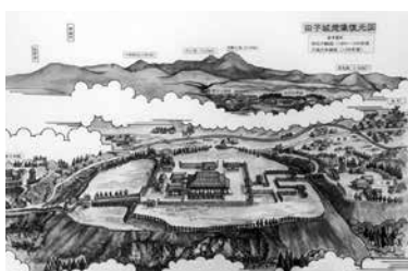
歴史の窓風景画第一弾 田子城