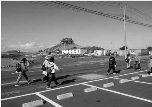
健康ウォークの様子