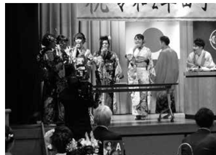
令和2年田子町成人式 祝賀会の様子