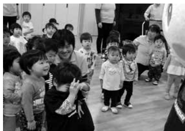
チャレンジデー2019の様子