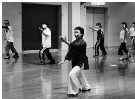
「太極拳講座」の様子