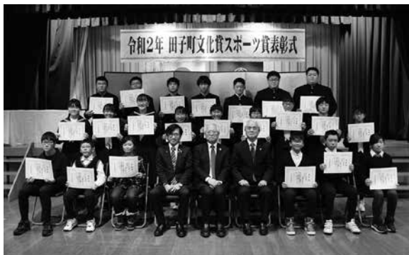
令和2年スポーツ賞受賞者