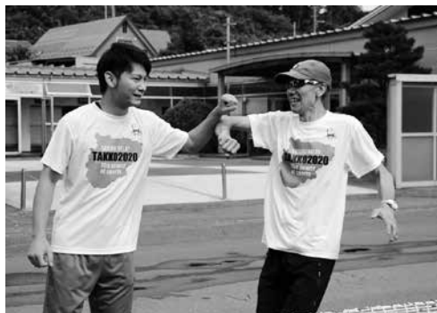
第66回大会代替イベント「TASUKIRIRE」の様子