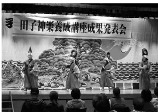
神楽講座成果発表会の様子