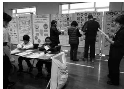
「田子ひとくるめ文化祭」の様子