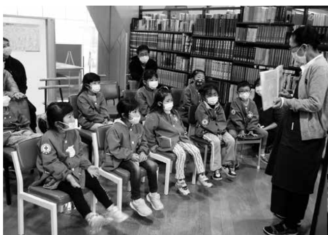
田子幼稚園図書館見学