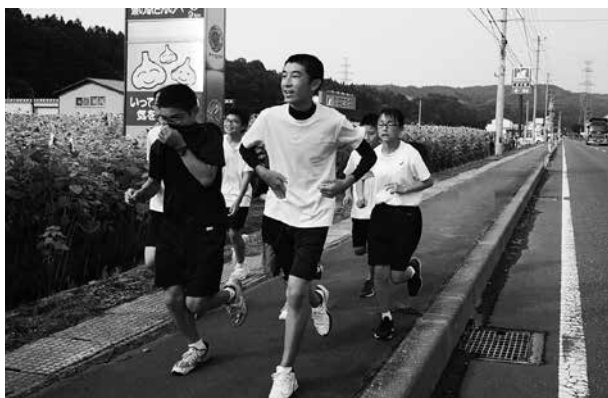
夏期練習会の様子