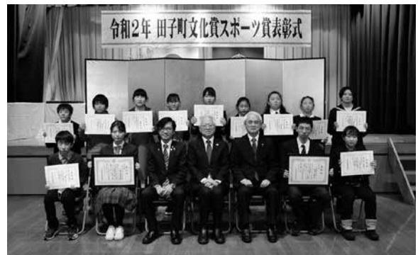
令和2年文化賞受賞者