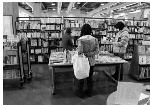
古雑誌・古本お持ち帰りコーナー