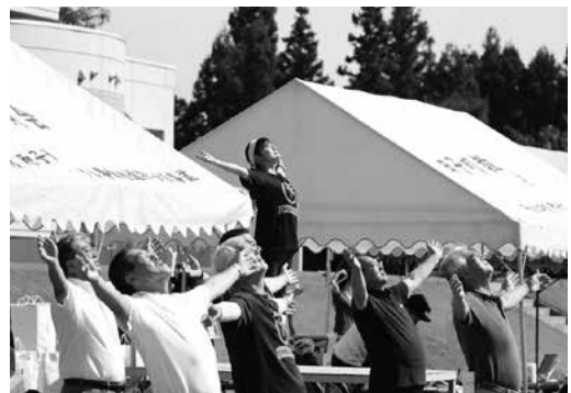
町民運動会で活動するスポーツ推進委員