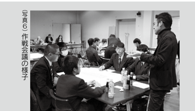
(写真⑥) 作戦会議の様子

「無理なく自分たちが楽しむ」ことを大切に、活気のある地域を目指し活動しているとのことがありました。 第2部では、松本准教授が進行を務め、「田子町でできた(あったら)おもしろいもの」を各々で考え、同様の考えを持つ参加者でグループをつくり作戦会議を行いました。各グループ柔軟な発想で、楽しく暮らすための意見を出し合いました。