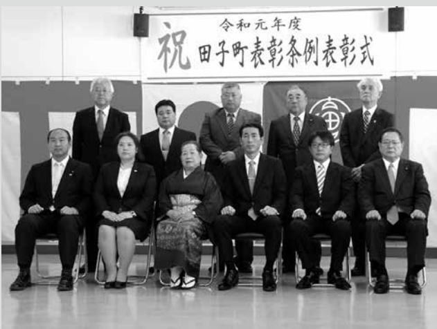
(写真2) 表彰式に出席された方々