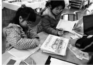
本を借りてスタンプを押します