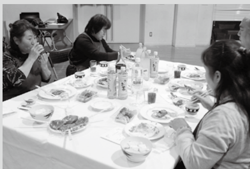
(写真4) 料理を味わつた参加者

関係人口という言葉が最近よく耳にしますが、交流会に参加して思ったのは、人口減少に抗うよりも田子町を想う人や興味のある人を増やし、そういった人たちに田子町の情報を定期的に伝えていくことが今の田子町に求められているのではないかと感じました。私にも何かその一翼を担えないか、そんな想いからこれまでの経験を活かして12月にタイとシンガポールに行くことにしました。どんなことをするのかはまたこちらで報告していきたいと思ひます。