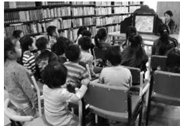
紙芝居は楽しいよ！

▽期間 12月21日(土)～1月9日(木)の7日間 ▽対象 小学生以下の子ども ▽内容 期間中に何冊の本を借りて読むことができるか、自分の記録に挑戦します。小さいお子さんは親子で参加できます。本をたくさん借りた人には賞状とプレゼントがあります。表彰式は1月11日(土)午前11時から。その後「紙芝居と本の読み聞かせ」があります。