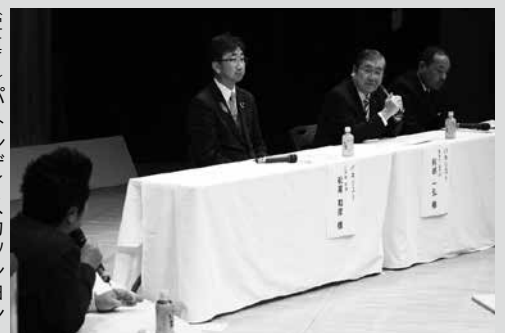
(写真1) パネルディスカッションの様子