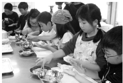
野菜たっぶりたわりサモサを