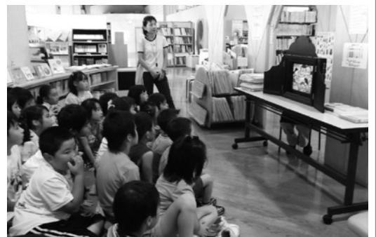
昨年度田子小1年生のみなさんが図書館見学しました