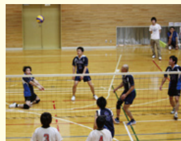
バレーボール協会

競技種目は、シンプルですが日々の積み重ねが記録につながります。みなさんからの応援で目指せ自己記録更新!