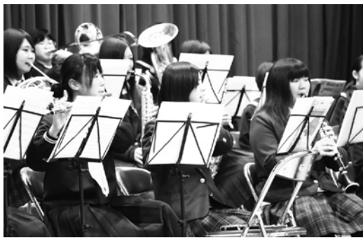
町小・中・高合同音楽祭の様子

していきたい。また、委託先の国際交流協会は、理事・職員皆様の努力により、収益事業では若干の利益が出ているとのことであり、引き続き経営努力をお願いする。国際交流事業におけるこれまでの経緯、実績等から、今後とも国際交流事業を担っていただきたいと考えている。