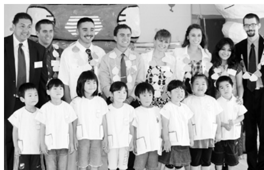
笑顔があふれる国際交流

①中高一貫の充実に努めるとあるが、義務教育である中学校に教員の加配を行い、中学生の基礎学力向上や受験対策への取り組みに力点をシフトしたらどうかと思うが、町長の考えは。②にんくが縁で育んできた国際交流事業については、大きな成果を上げてき