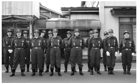
田子町消防団第9分団のみなさん

町では、消防団員を随時募集しています。町内に居住または勤務する18歳以上の健康な方であれば、どなたでも入団できます。誰もが安心して暮らせる地域づくりのため、一緒に活動しませんか？