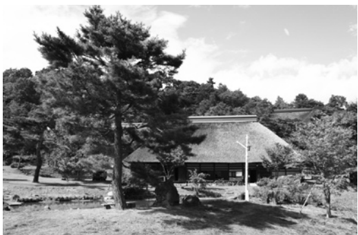
町の観光拠点として有効活用が期待される“創遊村”

平成20年度から「大黒森タプコプがっこう」を指定管理者としてお願いし運営している。12月末時点での