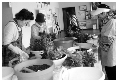
花の寄せ植え講座の様子