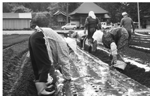
にんにく植えの様子