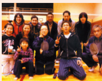
バドミントン協会

今年は優秀な会員が多数加入し、良い結果が期待できます。まずは団体戦2連覇を目指して頑張ります。