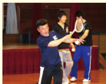
ソフトテニス協会

男子団体は、平均年齢50歳のチームですが、今年は体調が良いようで上位入賞が期待されます。女子団体は毎年あと一歩で入賞を逃してきました。持ち前のチームワークの良さで入賞を目指します。