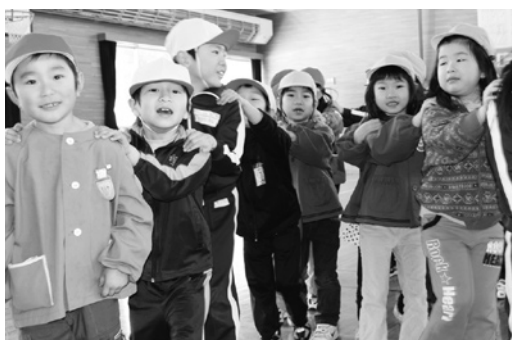
園児と児童との交流会

・中高一貫教育の充実に努め、「田子高校存続を求めると」連携をとりながら存続に向けて最大限努力し