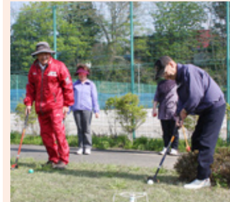
グラウンドゴルフ協会