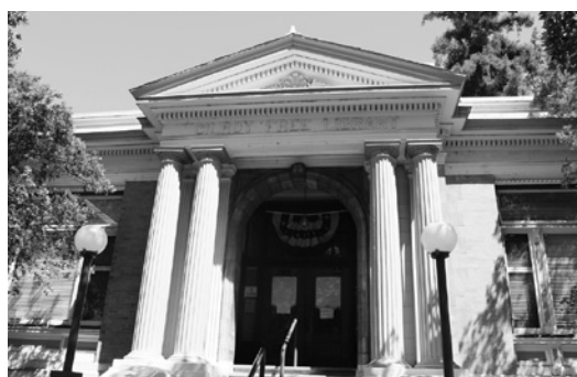
ギルロイ市の歴史が展示されている博物館

して楽しむことのできる素晴らしいフェスティバルでした。ギルロイ市の方々はとても優しく、そして温かく私たちを歓迎してくださり、一生忘れられない4日間を