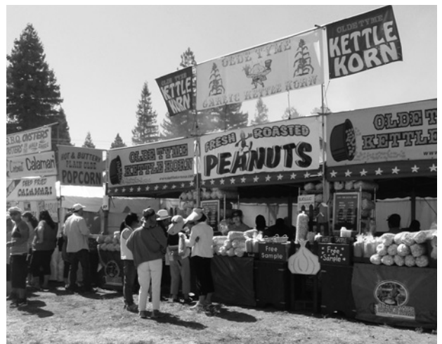
フェスティバルに花を添える出店の数々