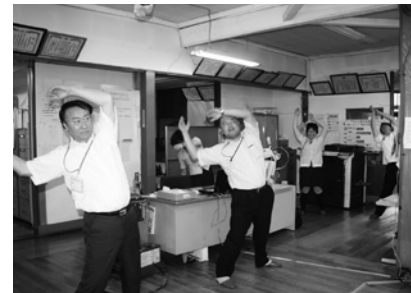
J A 八戸田子支店のみなさん

「町民みんなが元気で健康な町」を目指して、みんなで一緒に取り組んでいきましょう。