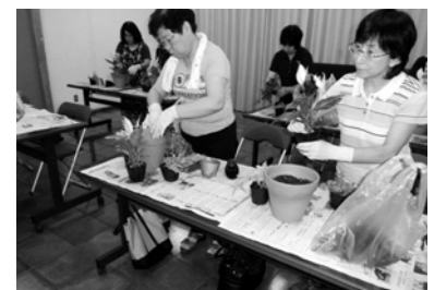
フラワーアレンジメント教室の様子