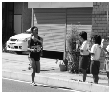
昨年の県民駅伝の様子