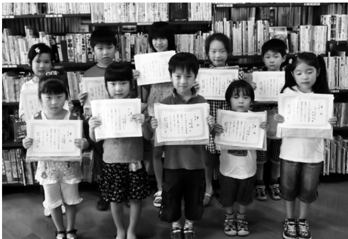
たくさん本を読んだよ

8月4日、決められた期間内に何冊の本を読めるか挑戦する「読書マラソン」の表彰式が行われ、上位入賞者に賞状と記念品が手渡されました。44回目になる今回の参加者は46名（うち上郷公民館3名）。1等賞（8日間で