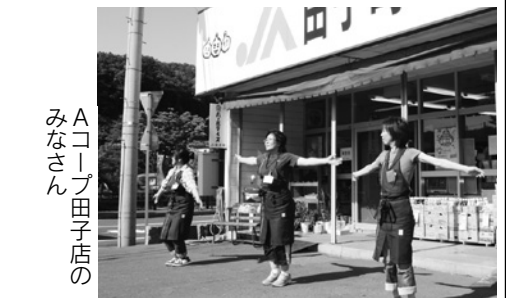
Aコープ田子店のみなさん