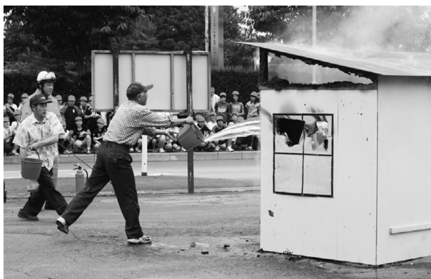
協力して行ったバケツリレーによる消火訓練

午後は田子小学校に現場 本部を設置し、住民の避難 誘導や交通規制、中継送水 など、防災関係機関による 訓練のほか、バケツリレー や消火器を用いたの消火訓 練など、町民も実際に参加 して防災訓練が行われまし た。