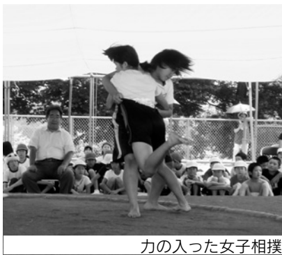
力の入った女子相撲