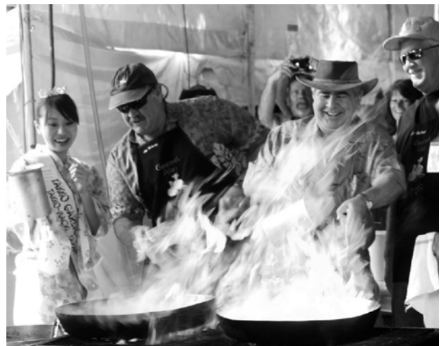
パイロシェフ(炎の料理人)体験