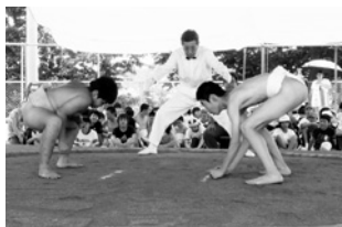
上学年はしきりもプロ級