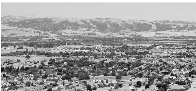
ギルロイ市の風景

ラツとした暑さで、日本よりも過ごしやすく感じました。ガーリックフェスティバルには多くのボランティアが参加しており、小学生から高齢の方まで幅広い年齢層の方々が生き生きと働いていました。会場には60以上の出店があり、にくにくを使った料理はもちろんです。デザートや工芸品（にくのアクセサリ・帽子・Tシャツ）などもあり