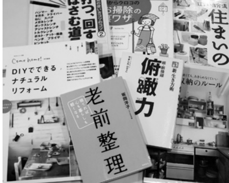
暮らしと住まいの本特集