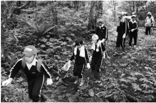
足下に注意しながら沢を渡る生徒

講習会では、AEDトレナーセットを用いて心肺蘇生法やAEDの扱い方を練習し、三角巾を使った応急処置では、足のねんざや腕を怪我した時の固定法、額や目を怪我したときの処置法を、自分の足や他の参加者を対象に練習しました。