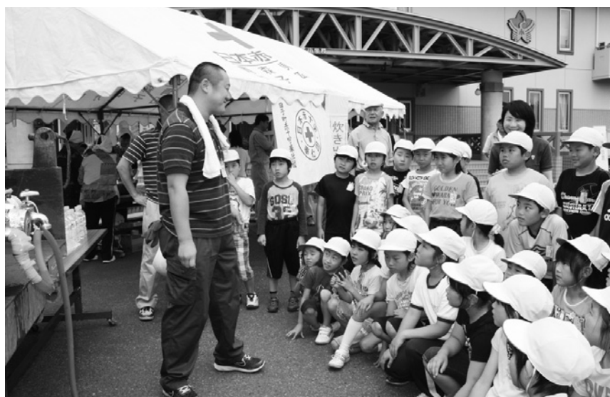
給水訓練の説明を聞く児童