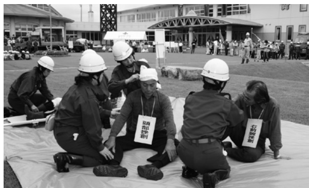
第9分団による応急処置訓練

訓練は、午前9時30分頃、 震度5強の地震が発生し、 町内各地で土砂崩れや家屋 倒壊等の被害が起きたこと を想定して行われました。 役場内には災害対策本部が 設置され、各自治会から報 告のあった被害状況を地図 上に整理し、分析を行った 後、防災機関へ協力の要請 などの対策を講じました。