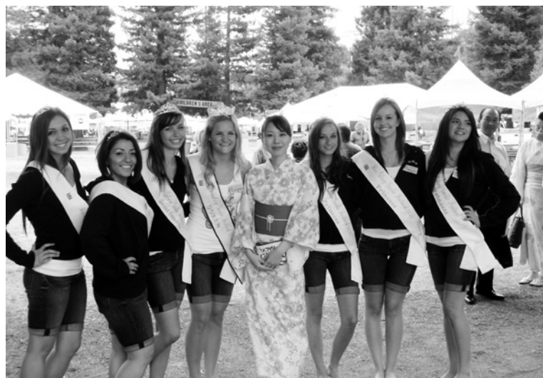
ガーリッククイーンのジュリアさん（左から4番目）とプリンセスたち

そうです。昨年のガーリックフェスティバルには3日間で13万人の方が訪れ、「全米最大の食の祭典」といわれています。会場は想像以上に広く、規模の大きさに驚きました。当日は晴天で日差しが強かったのですが、湿度が高くなくカ