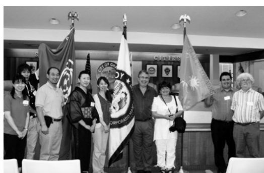
ギルロイ市長表敬訪問の様子

ました。また、どの年代でも楽しめるように、チルドレンズエリアや、エンターテインメントのステージも用意されていました。会場は非常ににぎやかで活気があり、見て・食べて・体験