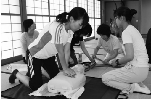
心肺蘇生法を練習する参加者