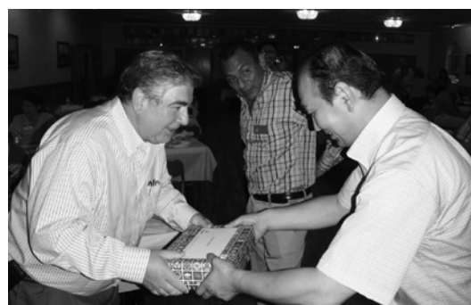
アルピネイロ市長（左）

ました。また、どの年代でも楽しめるように、チルドレンズエリアや、エンターテインメントのステージも用意されていました。会場は非常ににぎやかで活気があり、見て・食べて・体験