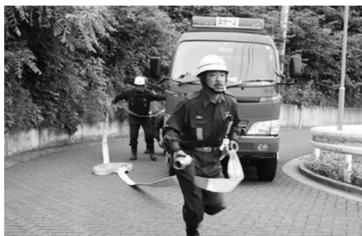
中継送水訓練の様子