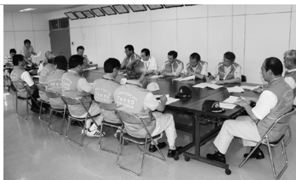
災害対策本部の様子