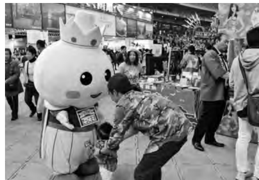
たっこにんにくPR活動