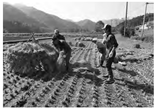
伝統的農法「にお積み」で昔ながらの農村風景を残しています