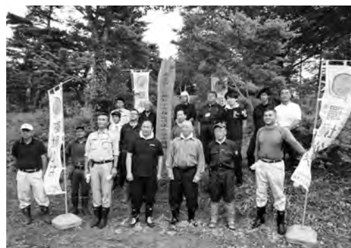
環境公共事業の様子