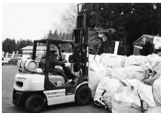
農業用廃プラ回収作業