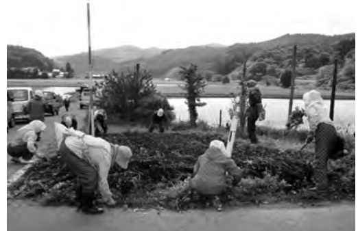
集落ぐるみで花の植栽を行っています