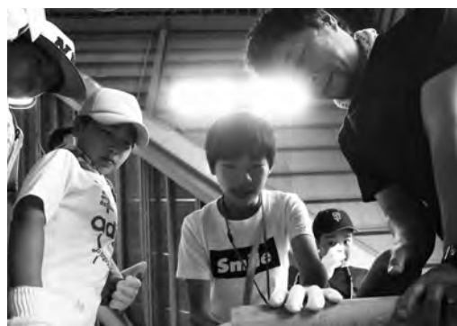
丸太切り競争の様子