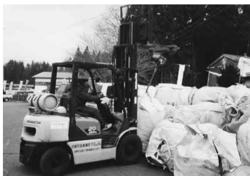
農業用廃プラ回収作業