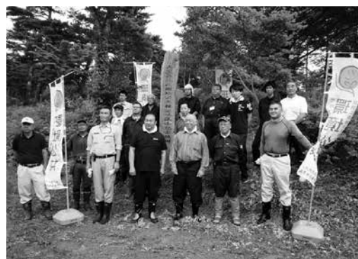
環境公共事業の様子