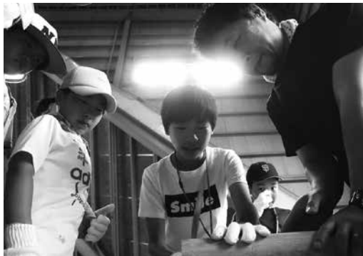
丸太切り競争の様子