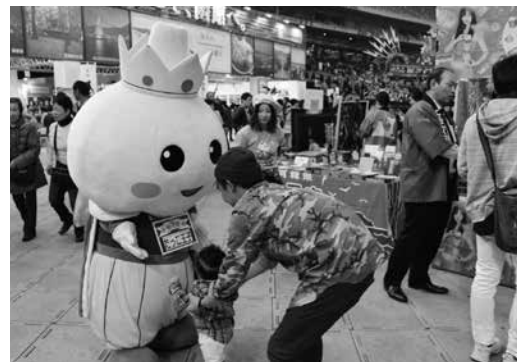
たっこにんにくPR活動