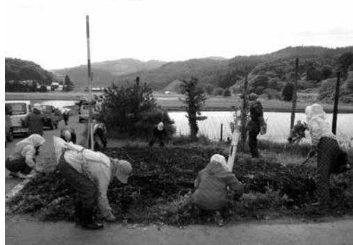
集落ぐるみで花の植栽を行っています