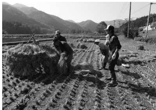
伝統的農法「にお積み」で昔ながらの農村風景を残しています