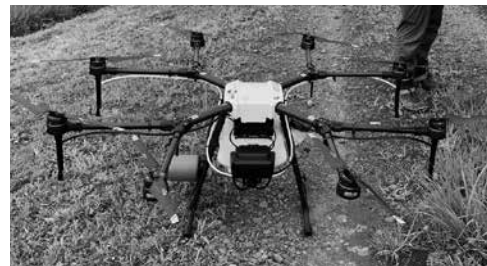
今後の活躍が期待される 農業散布用ドローン