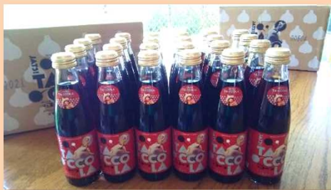
ジャッツ！タッコーラ 24本 (たっこにんにく入りコーラ)