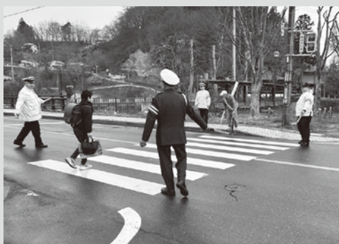
(写真3) 朝の街頭指導の様子