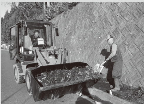
（写真6）泥上げをする町民の方々