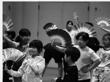
田子神楽養成講座

※日程や内容を変更する場合があります。講座に関する情報は都度TCVやデータ放送、チラシでお知らせします。