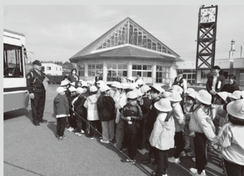
（写真5）バスの死角について学ぶ児童たち

当日は晴天に恵まれ気温も高くなる中、日頃から利用する場所を自分たちの手できれいにしようと、子ど