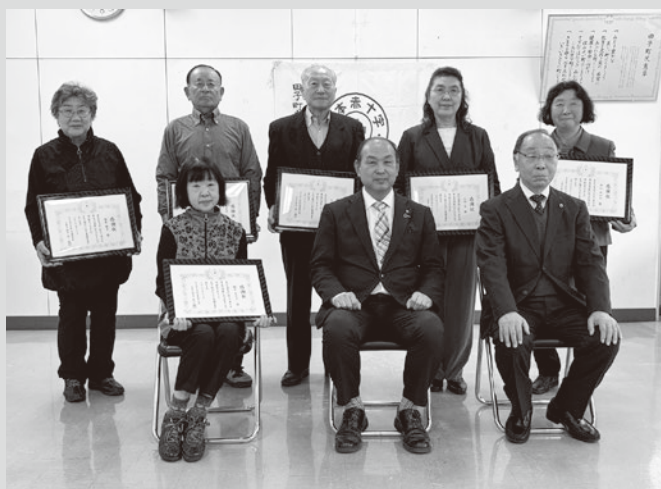
(写真1) 功労表彰の伝達を受けた受章者の皆さん