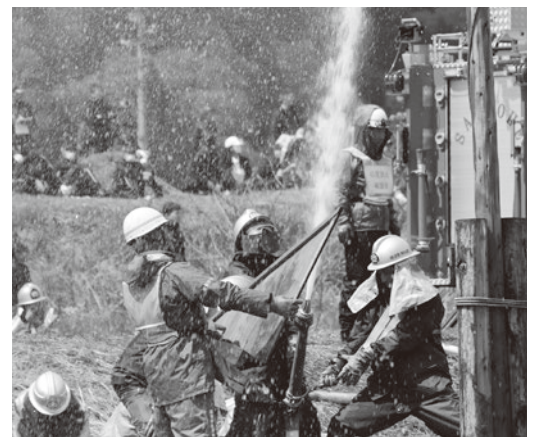
玉落とし競技自動車ポンプの部 第6分団