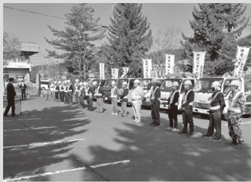
（写真7）出発式の様子