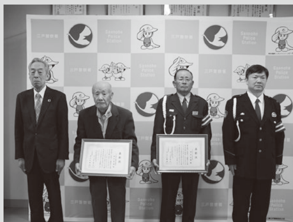
(写真⑧) 表彰式の様子

町では、みろくの滝にちなみ「交通死亡事故ゼロ3690（みろく）日」を目標にしています。目標達成のためには、皆さん一人ひとりが交通ルールとマナーを守ることが大切です。これからも交通安全に心がけ、住みよい町を目指しましょう。