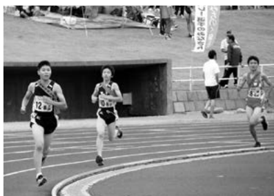
アンカー獅子内選手（左から2番目）のラストスパート