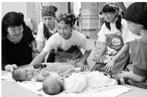
双子の赤ちゃんに声をかける生徒ら