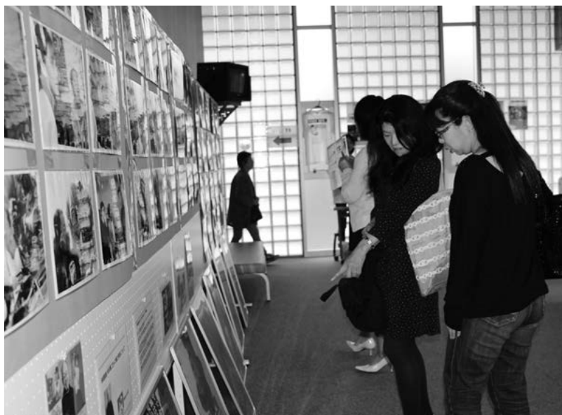
相米監督映画のポスター展示を見る来場者