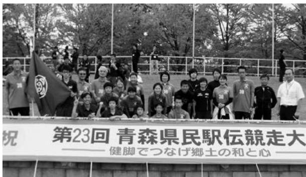
田子町選手団とスタッフ