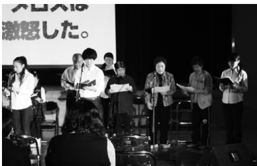
声をそろえてセリフを言う参加者

チームを結成してから3年目での初優勝ということで非常にうれしく思っています。一緒にプレーしてきた中高生は、一生懸命試合に取り組んだことで個人のレベルアップにもつながりました。来年は2連覇を目指したいと思います。