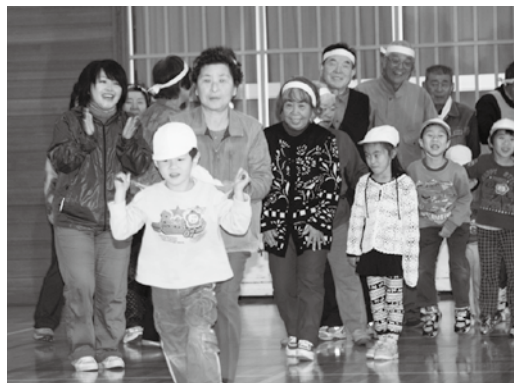
←落とさないように気をつけて！ 人形を運ぶ競技「えっさほいさ」