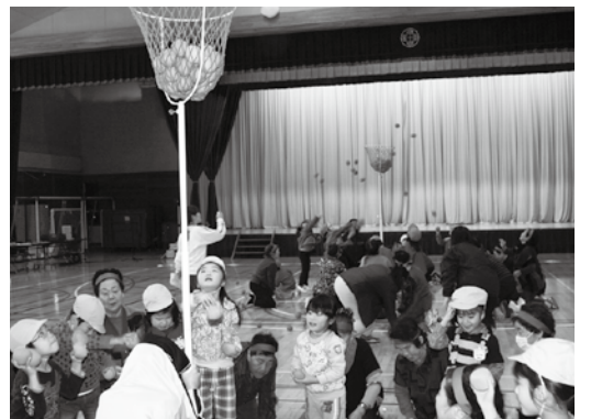
→みんなで力を合わせて玉入れ。 いくつ入ったかな