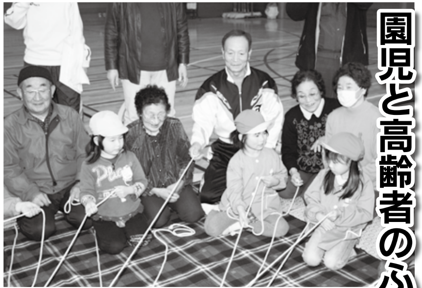
みんなで「どっぴき」を楽しみました