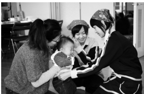
赤ちゃんに衣服を着せる生徒

11月30日、田子中学校3年生の生徒らが保健福祉支援センターを訪れ、赤ちゃんふれあい体験を行いました。これは、家庭科の授業の一環で、毎年行われているものです。