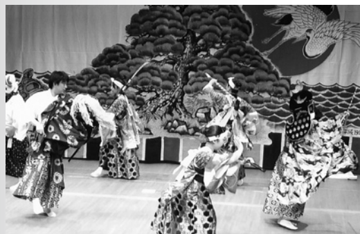
昨年の様子。田子神楽保存会技芸部（上）、田子町ナニヤドヤラ保存会（下）