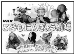
人形劇です。NHK教育 テレビの人気番組でした