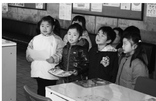
いつもお仕事ごころうさまです

11月16日、田子幼稚園宇宙組の園児らが町役場をスタートし、図書館や三戸消防署田子分署などの公共施設を訪れ、勤労感謝の日に先駆けて職員らの労をねぎらいました。役場を訪れた