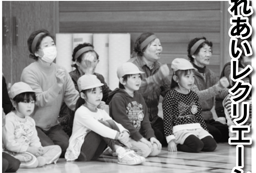
「うさぎとかめ」を歌いながら交代で肩たたき