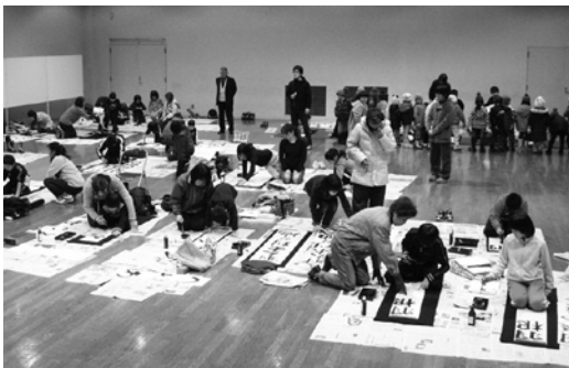
昨年度の大会の様子

中学生「輝く世界遺産」 高校・一般「萬物生光輝」 詳しくは、後日配布のチラシをご覧ください。