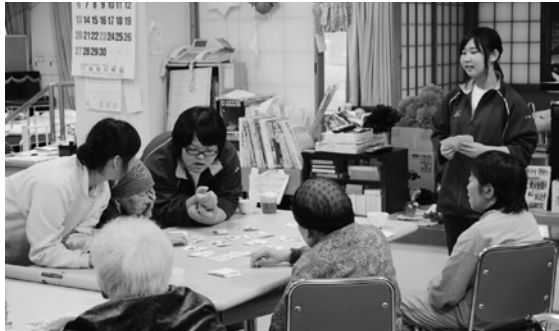
一緒にかるたの絵札を探す生徒

八戸農業協同組合では、生徒がにんにくの包装やラベル貼りといった業務を体験しました。慣れない仕事に休憩時間はぐったりとし