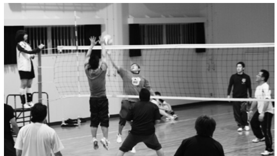
思いつきバレーを楽しみました

好きなので楽しいです。将来、介護の仕事に就きたいと思っているのが、大変なことでも知ることができて良かった」と話し、進路決定の参考になったようでした。