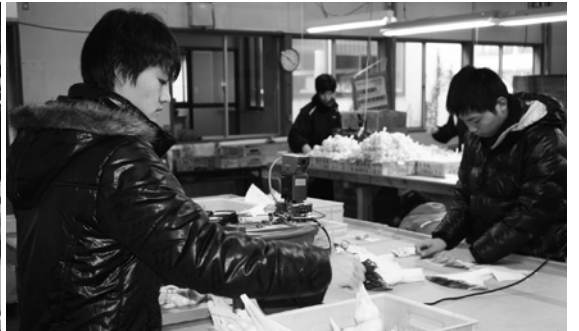
黙々とにんにくの包装を行いました