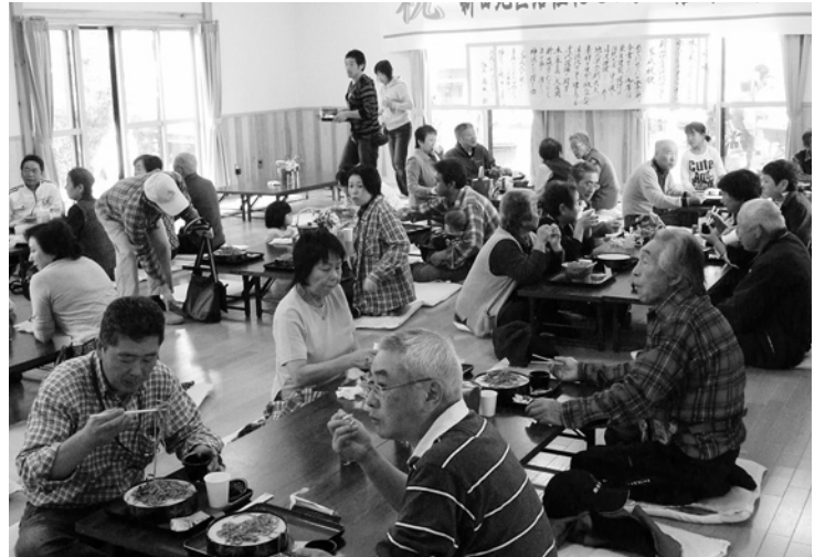
●13 新そばを味わう行楽客でにぎわう

た新そばを江戸時代から使われている水車を使い、「搗きたて」「打ち立て」「茹でたて」にこだわった風味豊かな手作りのそば700食。会場には地元の農産物や郷土料理の出店が並び、大盛況でした。