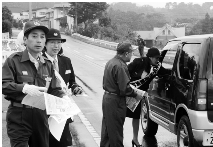
●11 手作りのマスコットとチラシを手に防火を呼びかける

10月17日、田子町消防団員と三戸消防署田子分署員が、防火パレードと街頭防火キャンペーンを行いました。「火の用心」ののぼりを立てた消防車両8台が町内全域をパレードし、また、田子分署前では、ドライバーに手作りのマスコットや住宅防火のチラシを手渡しながら、「秋の火災予