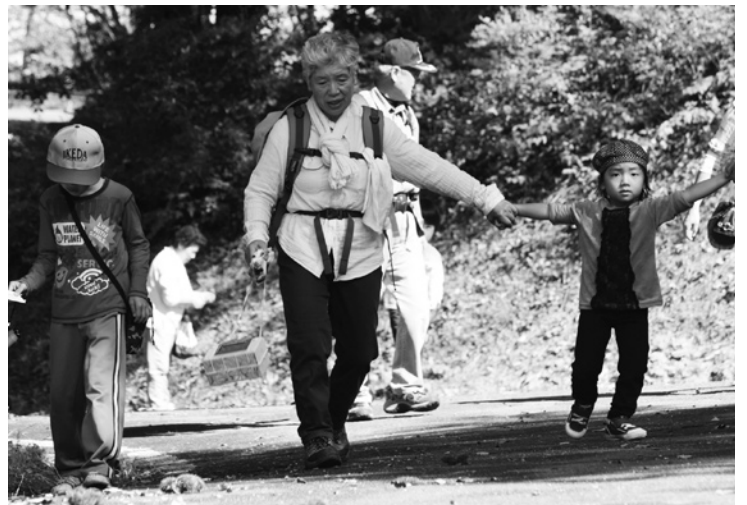
●14 栗やドングリを見つけて喜ぶ子どもたちと一緒に

学校から大黒森ウッドハウスまでを往復するコース、約13kmに、町内外から参加した