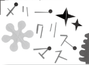
12月25日のとしよかんクラブはクリスマスカードを作ります