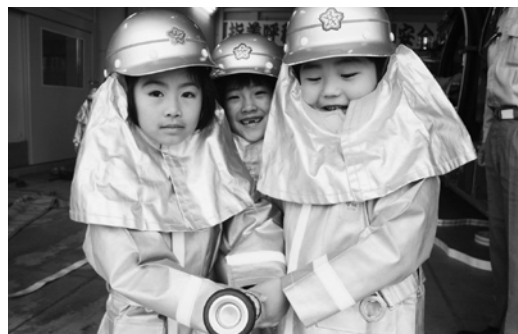
キマツテルでしょ?