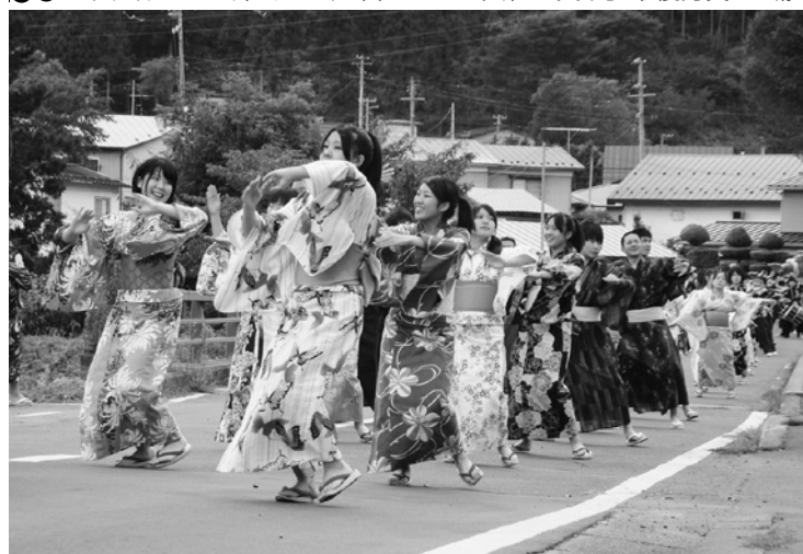
●6 女子は艶やかに、男子は揃いの衣装で息の合った踊りを披露