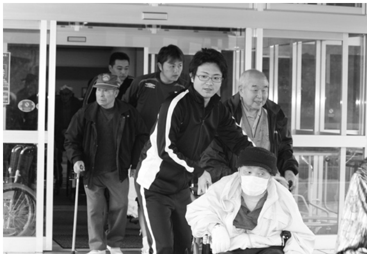
●12 避難訓練をするみろく苑の職員と入所者の皆さん

10月31日、平成22年度田子町消防団防火訓練が、みろく苑敷地内や周辺を会場に行われました。訓練は、大地震により、みろく苑で建物火災が発生したと想定し、みろく苑職員による入所者の避難誘導、田子町消防団の炊き出し訓練、消防ポンプ車両8台によるJ A