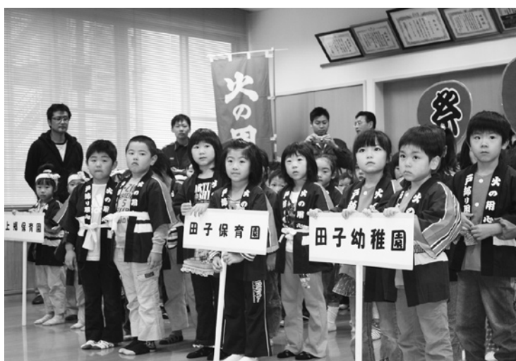
●10 3つの防火の誓いを発表する園児たち

10月15日、三戸消防署田子分署を会場に、防災広場「たぶこぷキッズパーク」が開催され、幼年消防クラブ員41人と保護者らが参加して防災意識を高めました。開会式では、「僕たち私たちは守ります 火の用心」など、3つの防火の誓いを発表し、放水体験や煙体験、消防車両の見学など