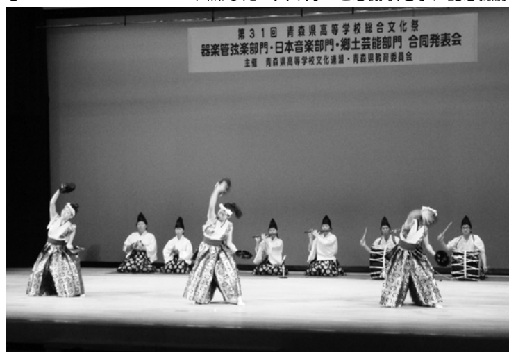
●5 大会テーマ「花ひらく 津軽の里に 文化の実り」最優秀賞の芸能

第31回青森県高校総合文化祭が、10月29日から31日までの日程で開催され、31日に青森市の青森明の星高校・明の星ホールで行われた郷土芸能部門で、「田子の杜の芸能」を演じた田子高校郷土芸能部が、3年連続となる最優秀賞を受賞し