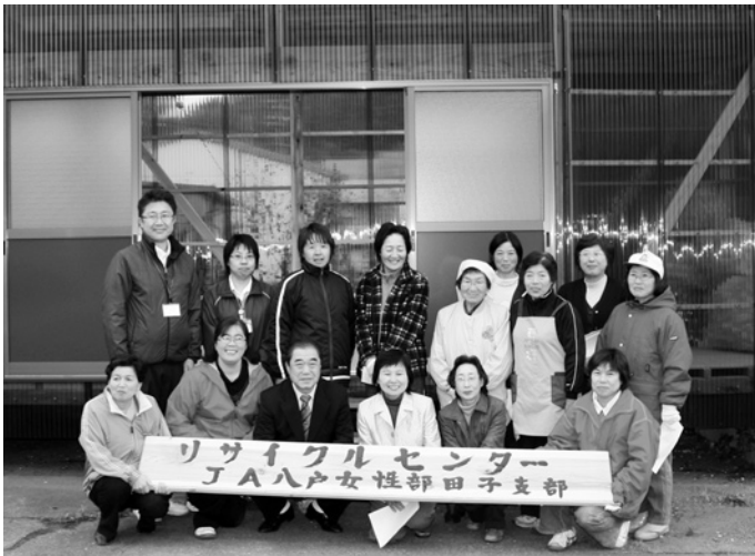
●8 完成したストックヤードの前で記念撮影