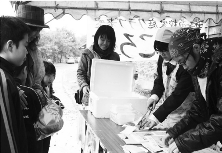
●3 創遊村で試食会を行う田子高校家庭クラブの生徒たち

10月6日、青森県高校家庭クラブ連盟研究発表大会で、田子高校家庭クラブが最優秀賞に輝き、12月10日に秋田県で行われる東北大会へ出場します。同クラブは、昨年6月か