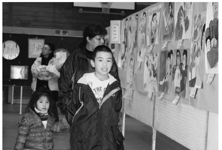
●15 親子で楽しんだ町文化祭。ボクの作品はどこかな？

10月30日から11月1日の3日間、第45回田子町文化祭が、中央公民館と農業者トレーニングセンターを会場に開催されました。中央公民館では、子ども会による屋台や上郷小6年生によるバザー、お茶会、昔遊びのコーナーやニュースポーツ体験コーナーなどが設け