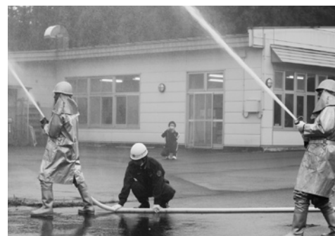
中継送水訓練の様子

八戸C A冷蔵庫からの中継送水訓練などです。災害時における迅速・的確な応急対策活動の重要性を確認しました。