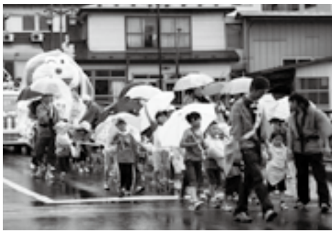
雨にも負けず、元気いっぱいの山車運行