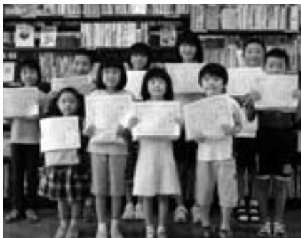
読書家のみなさんです

決められた期間内に何冊 の本が読めるか挑戦する 「読書マラソン」が終了し ました。38回目になる今回 の参加者は28名、1等賞(9 日間で45冊読破)から3等