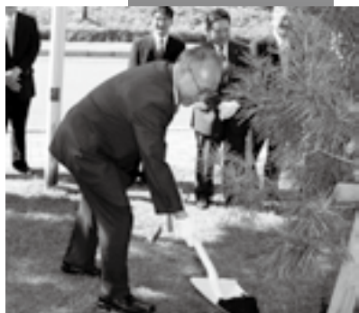
植樹をする一ノ渡会長（左写真）と松橋町長（下写真）