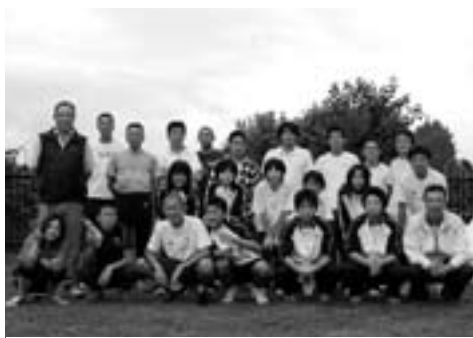
昨年度駅伝メンバーとスタッフ

第17回青森県民駅伝競走大会 9月6日(日)、第17回青森県民駅伝競走大会が青森市の市街地コースを会場に、「健脚でつなげ郷土の