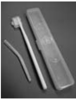
試供品をプレゼント

しかし、歯周病の救いは、きちんと歯の汚れを落とし、歯周病菌の数を減らすことで薬を使わなくても改善できることです。効果的な歯の磨き方は意外と難しく、コツがあります。一番悪い磨き方は、①力まかせ②大振り③歯磨き粉のつけすぎで、泡が多くなり、磨いたつもりが全部の歯に歯ブラシが当たっていない状態です。