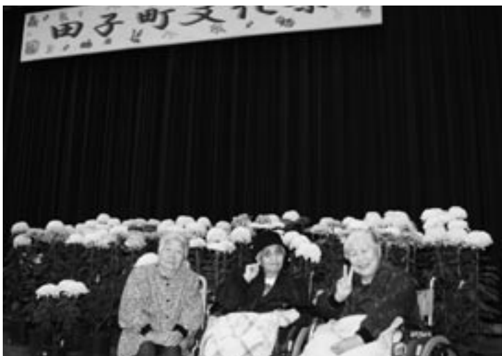
菊花展の前ではいポーズ!