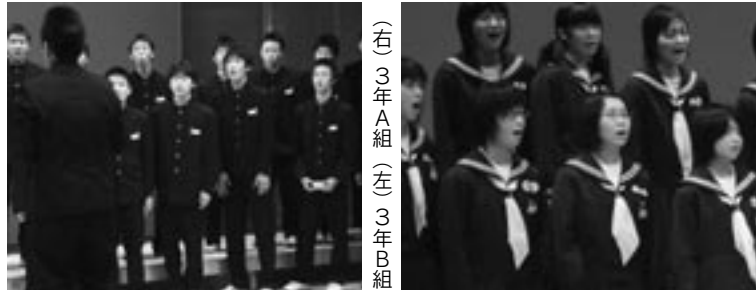
(右) 3年A組 (左) 3年B組

2年生には勢いがありました。あわよくば3年生を追い越して最優秀賞を勝ち取ってやろうという意気込みも感じられました。1年