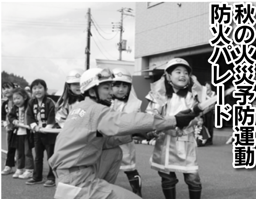
放水訓練がんばるぞ！