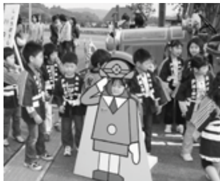
顔を出して記念写真

10月19日、秋の火災予防運動の一環として防火パレードが行われました。これは、消防機関及び各幼年消防クラブが一堂に会し、広く町民に火災予防を呼びかけることを目的としたものです。 田子小学校金管バンド、田子幼稚園・田子保育園・上郷保育園・田子町消防団など計137人が参加したパレードは田子町商工会館前から始まり、国道104号を通って消防署前まで行われました。その後、消防署で「たぶこびキッズパーク」が行われました。キッズパークでは「それいけにんくまん」と題した寸劇が行われ、火事の怖さや防火の大切さを学んでいました。また園児は消防服に着替え、消火訓練を行いました。