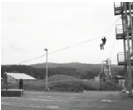
緊張感漂う降下訓練