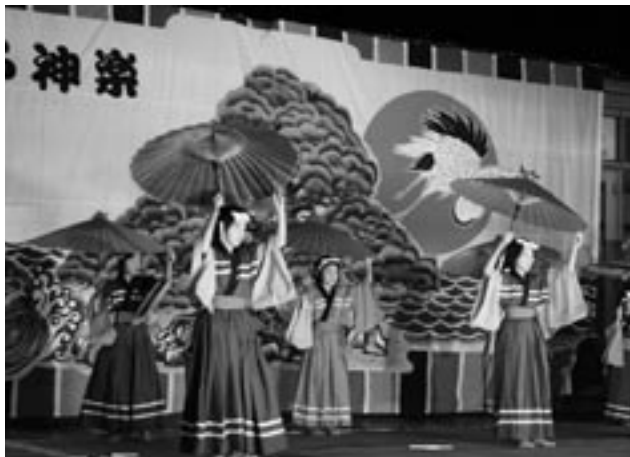
神楽講座の成果を披露する受講生。傘舞（上）盆舞（下）

果発表会が開催されました。この発表会は、神楽講座受講生の成果発表会の場として毎年開催しております。