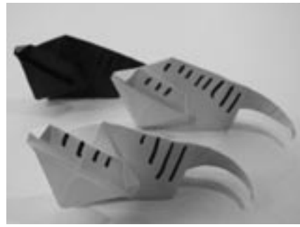
12/26のとしよかんクラブは「とら」の折り紙です

づいてきました。子ども向けにクリスマス絵本、十二支のお話など楽しい本を、大人向けにはドライフラワーやリース作り、季節の料理、お正月の飾り付けの本、クリスマス音楽CDなどを揃えて展示・貸出します。どうぞご利用ください。 ○サンタのいちねんとナカイのいちねん ○サンタのひみつおしえます