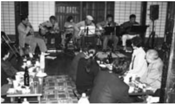
秋の夜長に音楽を楽しむ

たちの食育やあいさつを推進するために行われたものです。収益金の一部で「伸びる子は早寝・早起き・朝