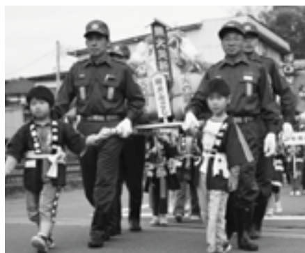
火の用心のおみこしを担いでパレード