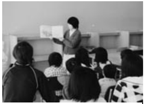
今日はどんな絵本かな？

4土曜日午前10時30分から「本の読みきかせ」と「よかんクラブ」を実施しています。お子さんやお孫さんと一緒に図書館で楽しいひとときを過ごしませんか？