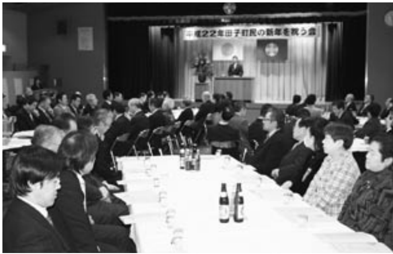
約100人が参加した田子町民の新年を祝う会