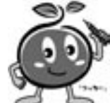
農林業センサスマスコットキャラクター つっちーくん

「2010年世界農林業センサス」を実施します。この調査は、我が国の農林業・農山村地域の実態を明らかにする最も基本的な調査です。