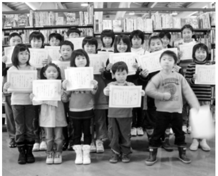
おもしろい本をたくさん読んだよ！