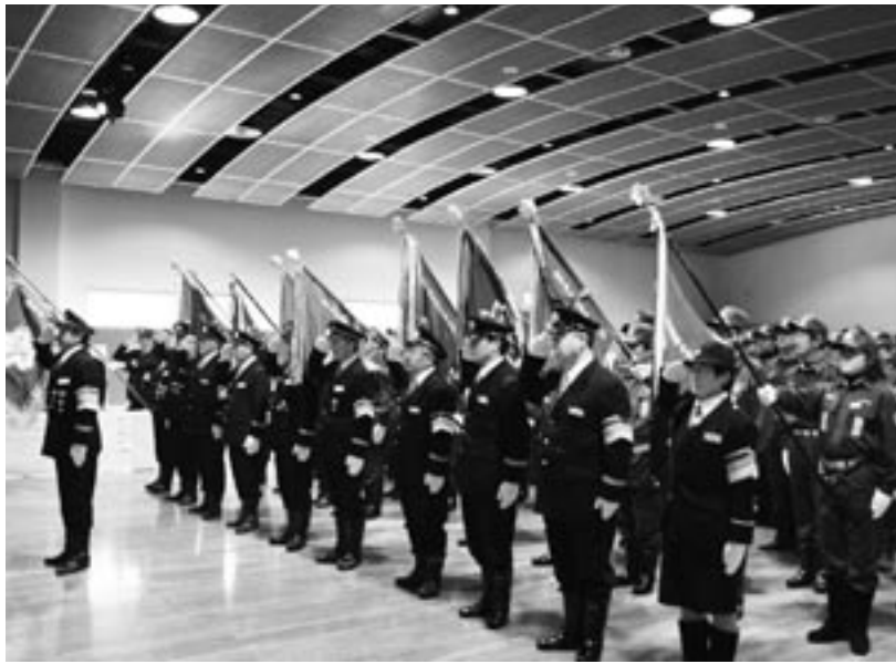
田子町消防団出初式式典の様子(中央公民館)

昭和35年から平成20年までの49年間、町と中本町で分収林契約を締結していた分収林が満期を迎えたこと