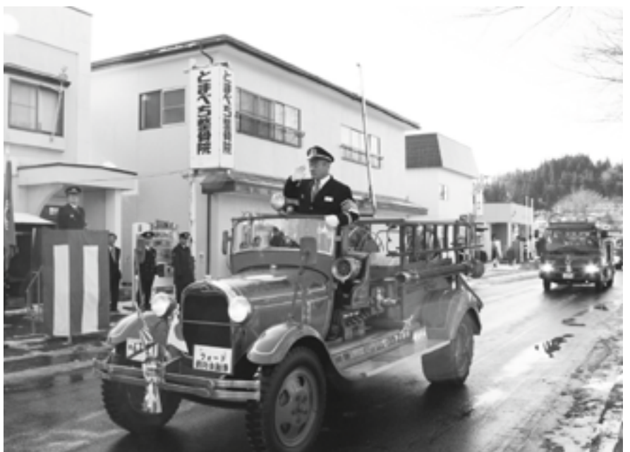
(写真上) まとい隊によるまとい振り披露 (写真中) 徒歩部隊による勇壮なる分列行進 (写真下) フォード消防車による分列行進

1月4日、サンモール周辺で「田子町消防団出初式」が行われました。田子川でのポンプ車による一斉放水訓練の後、徒歩部隊・車両部隊・まとい隊・ラッパ隊等が編成され、観閲者である松橋良則町長により部隊の観閲が行われました。その後、中央公民館ホールで行われた式典のなかで松橋町長は「寒さの中を堂々と展開された分列行進は、伝統を誇る田子町消防団の気迫を遺憾なく発揮されたものであり、心強く感じました」と訓辞を述べました。