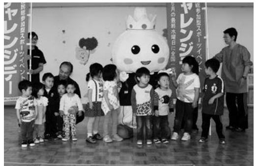
上郷保育園の子どもたちも参加