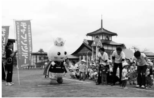
たっこ王子とリレー (田子保育園)