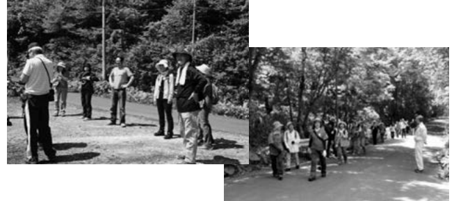
第2回 5月29日おぐにまきばルートの写真です