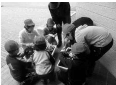
清水頭小学校全生徒