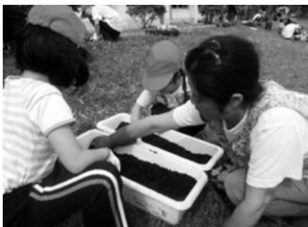
上郷小学校全生徒