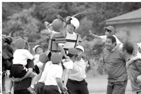
天下分け目の熊原川の合戦16 (上郷小)