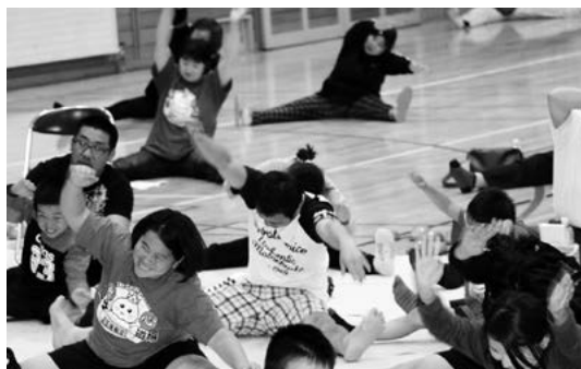
相撲体操はきつい