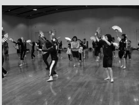
(写真3) 田子神楽に挑戦