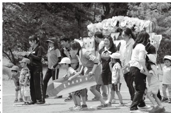
Go・Go・しんかんせん (田子幼稚園)

各小・中学校、幼稚園で行われた運動会は、子どもたち一人ひとりが勝利を目指して全力で駆け抜け、最後まであきらめることなくゴールを目指しました。