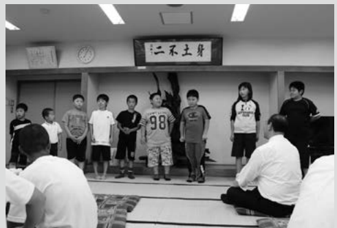
(写真10) 開講式で紹介される受講者