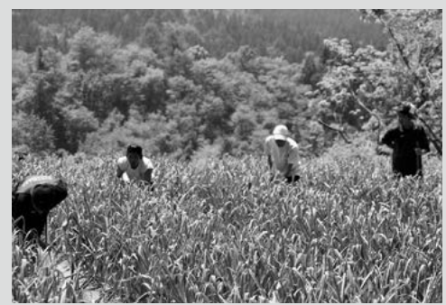
(写真4) にんにくの草取り作業