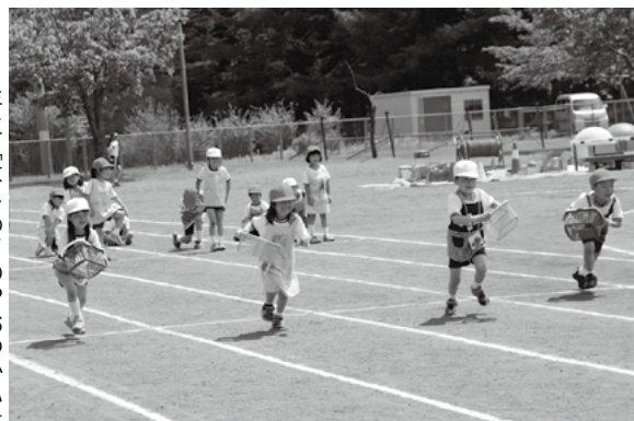
1年生「はじめての!?おつかい」 (田子小)