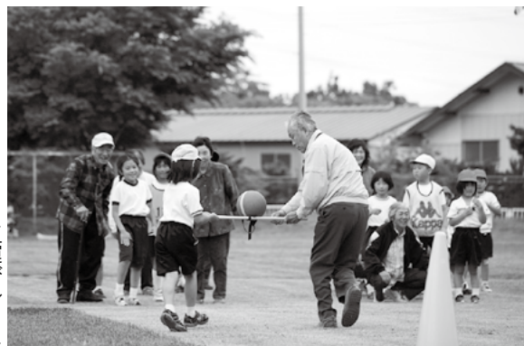
玉運びレース (清水頭小)