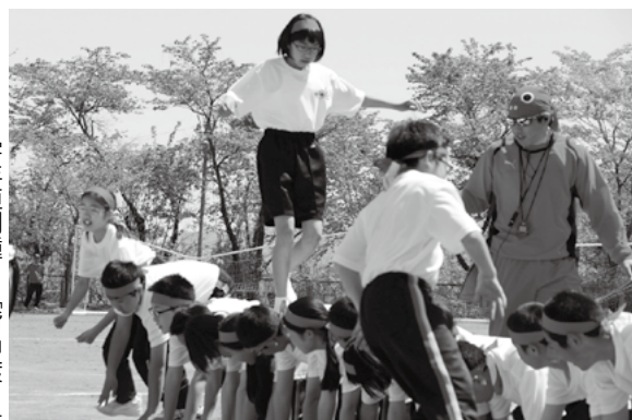
1学年恒例種目「背中渡り」 (田子中)