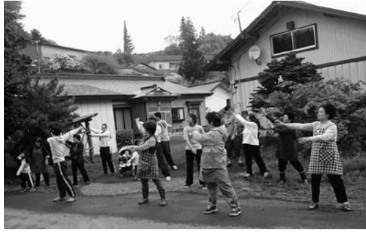
根渡地区でのラジオ体操

士が1日15分以上、運動やスポーツをした人の参加率を競います。今年は、佐賀県玄海町(初参加)と対戦しました。