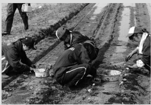
(写真5) 枝豆の苗植えを手伝ってくれました