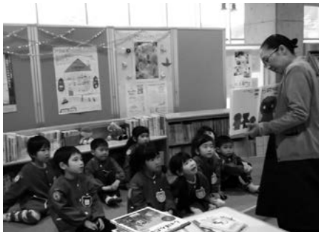
田子幼稚園図書館見学 (左写真)、親子ふれあい講座~夏休みは図書館に来てね