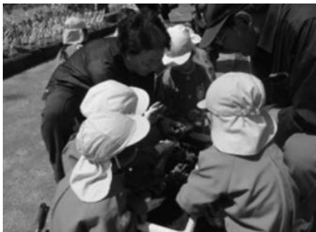
田子幼稚園全園児

今年度は、にんにくとべごまつりの会場での啓発活動や、田子高校での講演会などが開催される予定です。