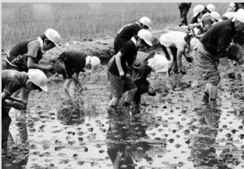
(写真9) 田子小学校の田植え