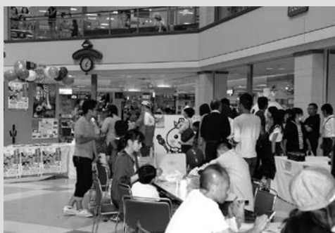
(写真11) にぎわいを見せた物産フェア