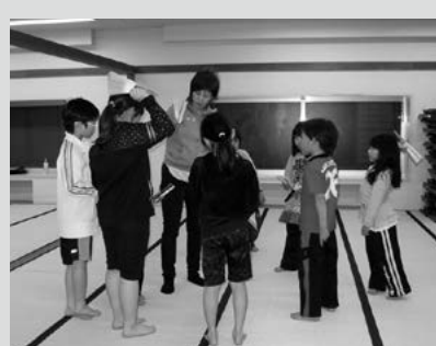
(写真2) 扇の扱いは難しいな