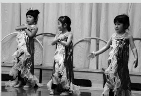
(写真2) 女の子はリトルマーメイドに