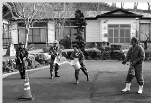
(写真4) 初期消火訓練の様子