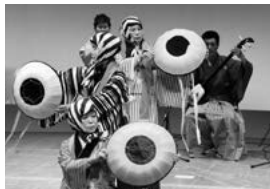
昨年の様子(民栄会)