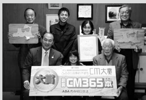
(写真1) 出演者で受賞を報告

その後の交流会では、持参した「つつけ」「煮しめ」「酒まんじゅう」などがテーブルに並び、参加者らは、口々に「懐かしい」「田子町を思い出す」などと話しながら、ふるさとの味を堪能していました。最後に来年の再会を約束し、万歳三唱で閉会しました。