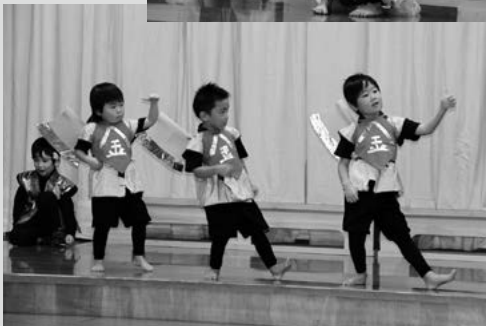
(写真3) 男の子は昔話のヒーローに