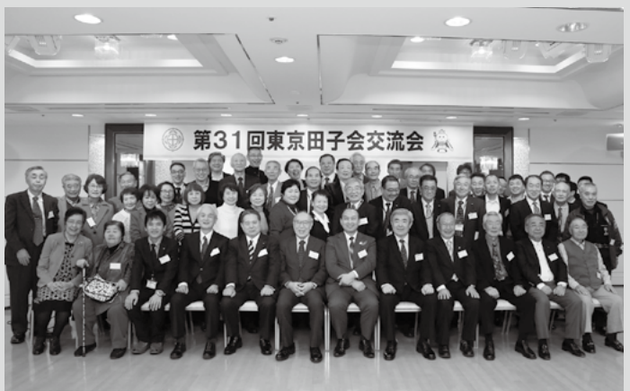
(写真5) 最後は全員で記念写真

◎東京田子会について、詳しく知りたい、参加してみたい方は下記までお問い合わせください。 ▽東京田子会事務局(役場産業振興課) ☎20-7114 E-mail : takko0402a@town.takko.lg.jp