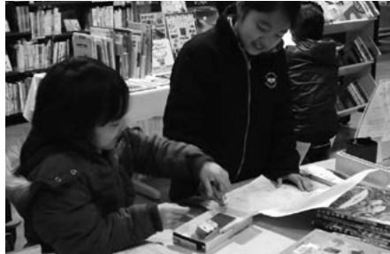
昨年度の読書マラソンの様子