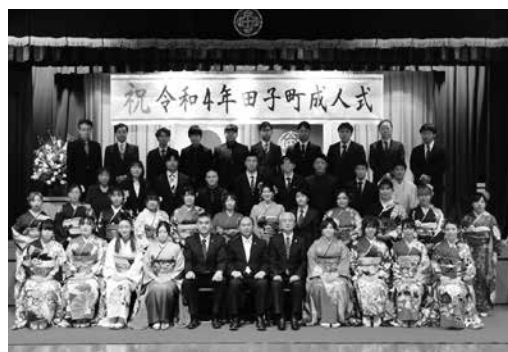
令和4年田子町成人式