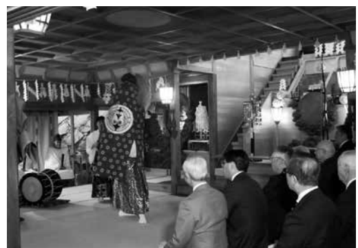
櫻山神社(盛岡市) 田子神楽奉納の様子