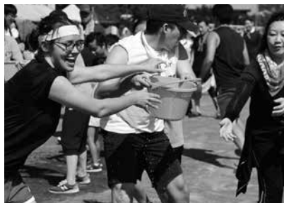
町民大運動会の様子