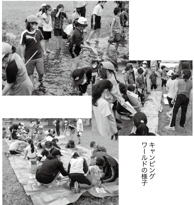
キャンピングワールドの様子