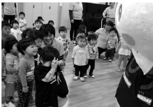
チャレンジデーの様子