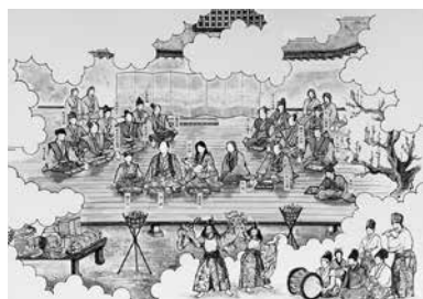
歴史の窓風景画第4弾 利直誕生の夏