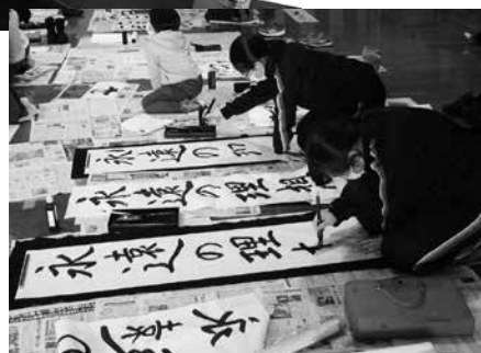
「新春書き初め大会」の様子