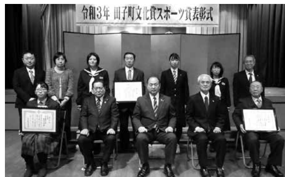
令和3年文化賞受賞者