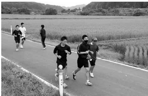
夏期練習会の様子