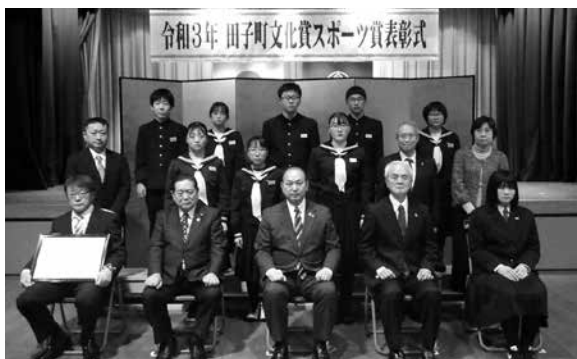
令和3年スポーツ賞受賞者