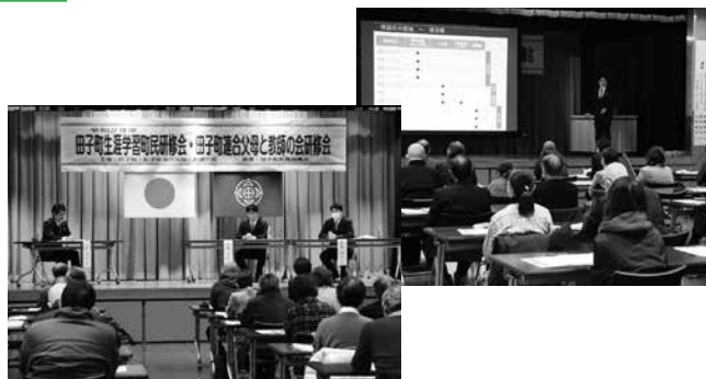
【令和2年度生涯学習町民研修会】 演題 「城づくりから見える南部氏の生き方について」 第一部 講演 第二部 トークセッション