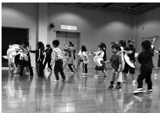
神楽養成講座の様子