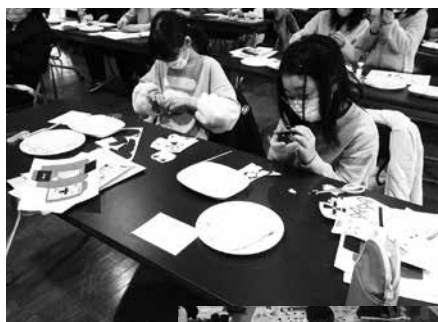
「ペーパークラフト講座」の様子