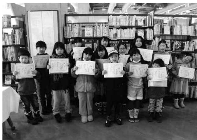
読書マラソン表彰式