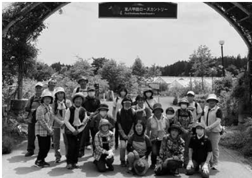
健康ウォークの様子