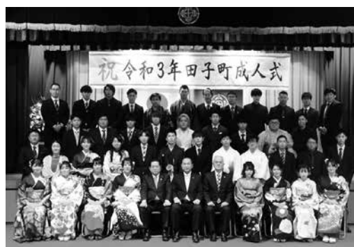
令和3年田子町成人式