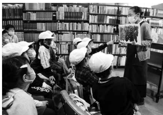
田子小学校図書館見学