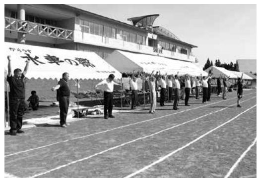
町民運動会で活動するスポーツ推進委員