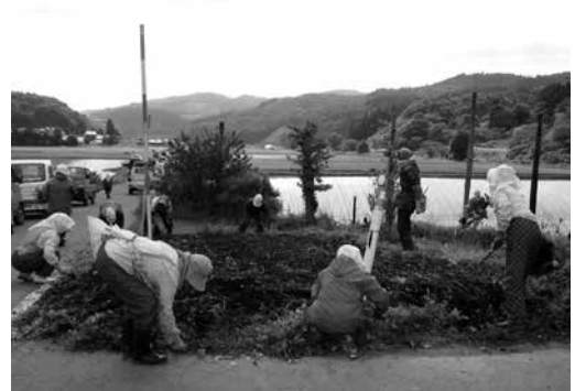
集落ぐるみで花の植栽を行っています