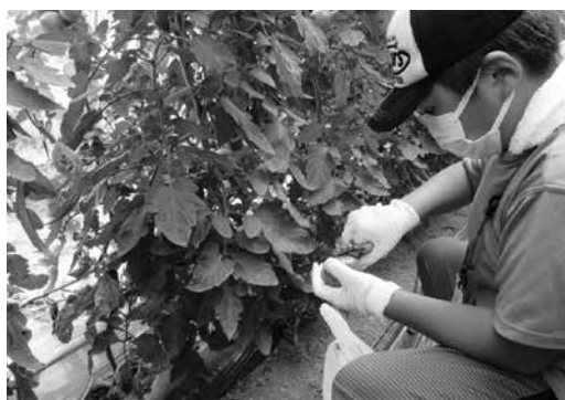
トマトの収穫体験の様子