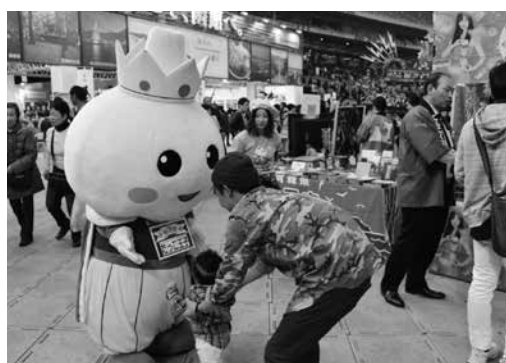
たっこにんにくPR活動