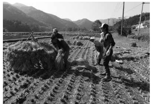
伝統的農法「にお積み」で昔ながらの農村風景を残しています