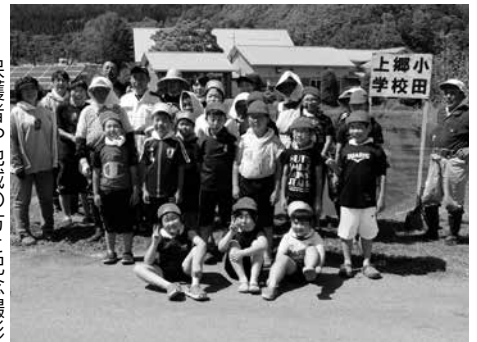
保護者や地域の方と記念撮影

今後も、地域に開かれた学校づくりを進め、家庭・地域・学校が一体となってたくましい子どもを育てていきたいと思ひます。