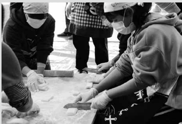
(写真7) 餅の切り分けにも挑戦