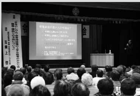
(写真10) 講演会の様子