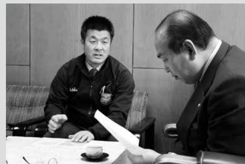
(写真6) 報告する下平専務取締役兼強化部長