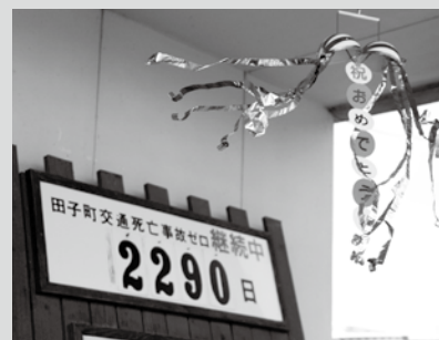
(写真13) 当時最長記録更新中！