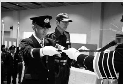
(写真3) 特別表彰された第3分団