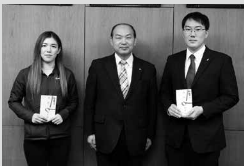
(写真2) 対象となった方々