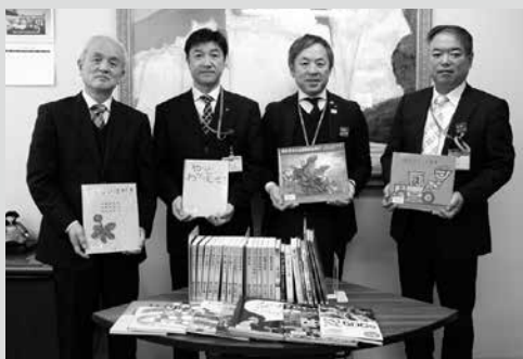
(写真1) 寄贈した江渡部会長 (左から2人目)