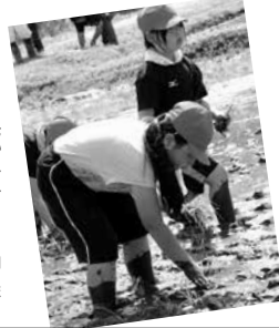
(右) 上郷小学校子ども神楽 (左) 田植え体験