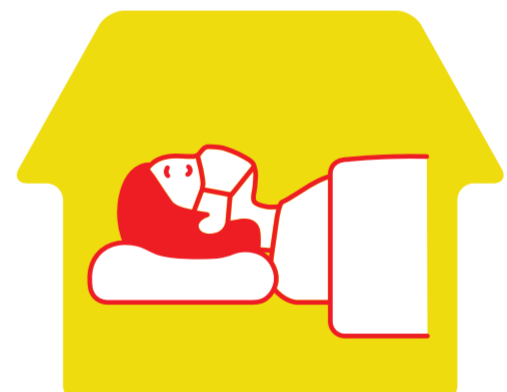
体調不良の場合は自宅で安静に