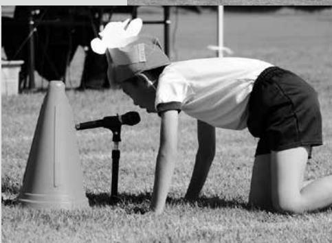
(写真3)清水頭小学校「I Love TAKKO 2020」