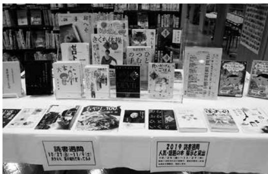
昨年の読書週間本の展示