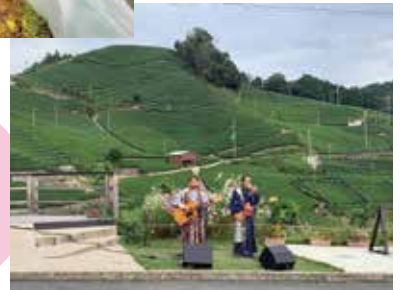
茶源郷和束PR大使による茶畑ライブを開催(京都府)

来年度は、田子町でも「田子町美しいまちづくり推進計画」のアクションプランに則った独自の取り組みを行いたいと考えています。