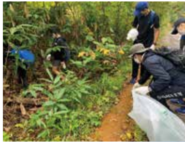
道内9町村地域で一斉ゴミ拾い活動を実施(北海道)

この他にも、いくつかの加盟町村では、ごみ拾い活動や草刈り活動等の環境美化活動が行われています。