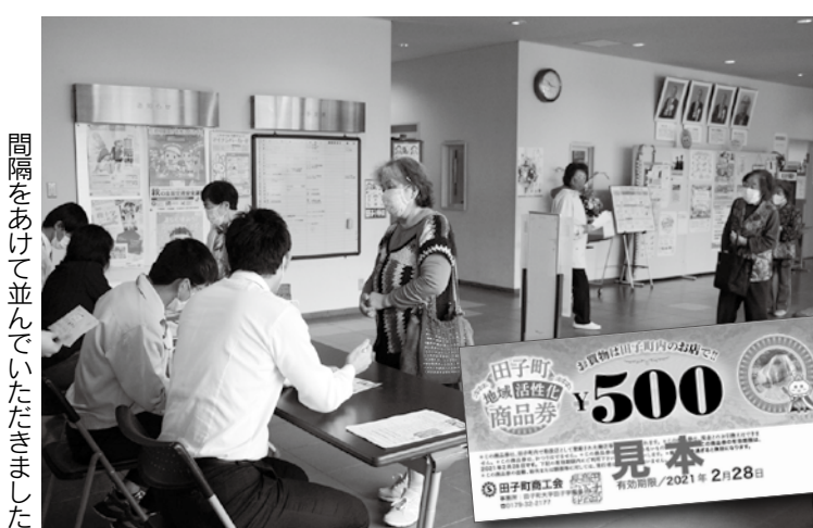
間隔をあけて並んでいただきました