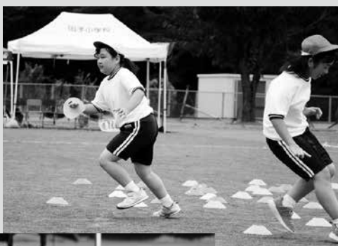
(写真2)田子小学校「Not Lose Virus」