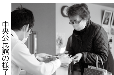
中央公民館の様子