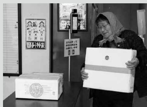
(写真1)荷物を運び込む利用者(中央公民館)