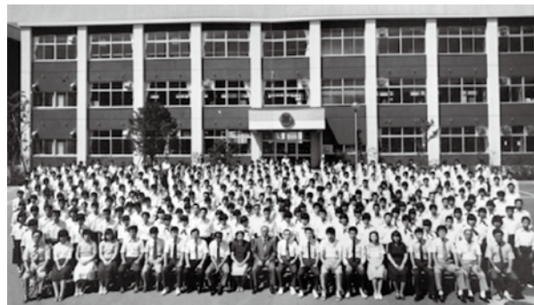
「三十年のあゆみ 創立30周年・校舎新築落成記念誌 1981」より

7月の引っ越しは暑かったことでしょう。中学校の坂道を下りて、高校まで上って、と机と椅子を持っての道中は休み休みだったようです。大変だったけれど、やっとたどりついた新校舎は、大きくて希望の光で輝いて見えたと思います。