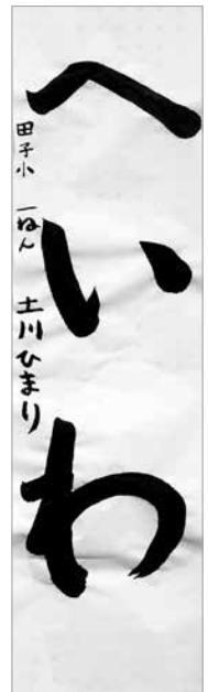
◎町長賞 土川陽葵 (田子小1)