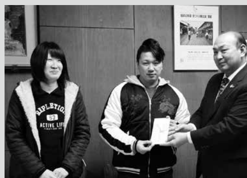
(写真3)対象となったご夫婦