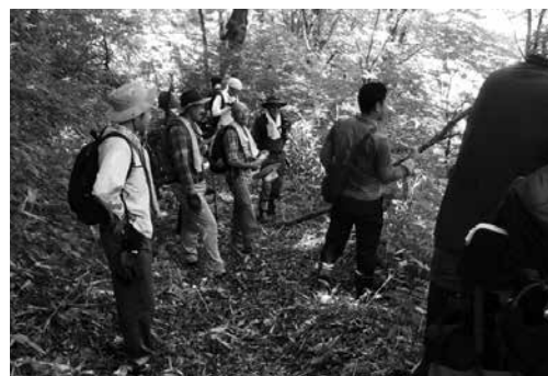
世紀越えトンネル現地踏査

世紀越えトンネルの整備促進については、青森県新広域道路交通計画において八戸鹿角圏域間として当路線が掲載され、構想案として認知されたことは大きな成果であります。本年も、関係部署並びに関係自治体