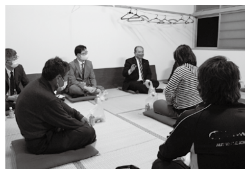
町長との対話集会

第3の方向性は「田子町 型地域共生社会の実現に向 けた組織活動の充実と仕組 みづくり」であります。