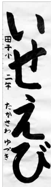
◎文化協会会長賞 高沢優月 (田子小2)