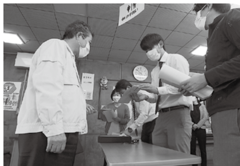
田子町地域にぎわい商品券配布

また、商工業支援では、 消費喚起と経済の活性化に 努め、コロナ以前まで回復 するべく取り組んでまいり ます。さらに、町民にとつ て、燃油の高騰や物価の上 昇は大きな負担となってい ることから、燃油高騰対策 支援を実施し、その他、国 が行う各種支援について は、遅延することなく、体 制を整えて対応いたします。