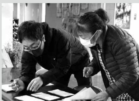
(写真2)受け付けの様子(上郷公民館)