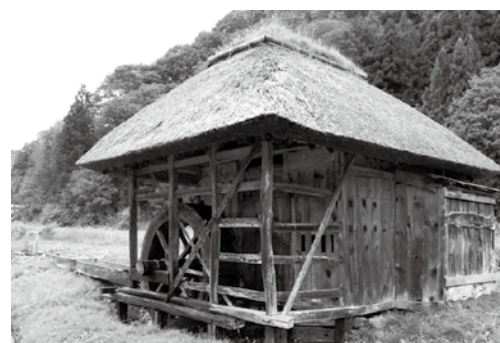
新田地域の水車小屋

田子町の美しさは、優れ た景観の他、豊かな地域文 化としての食、伝統芸能や 様々なスポーツ文化活動、 歴史や田子町らしい産業な どに象徴される町民の営み にあり、これを守り、さら に進化させ、継承させてい くことが大切であります。 令和2年度に策定した、田 子町美しいまちづくり推進 計画を、より具体的な取り 組みとして、町民と行政が 協働で取り組み、第六次田 子町総合計画の目的達成に 向け推進してまいります。