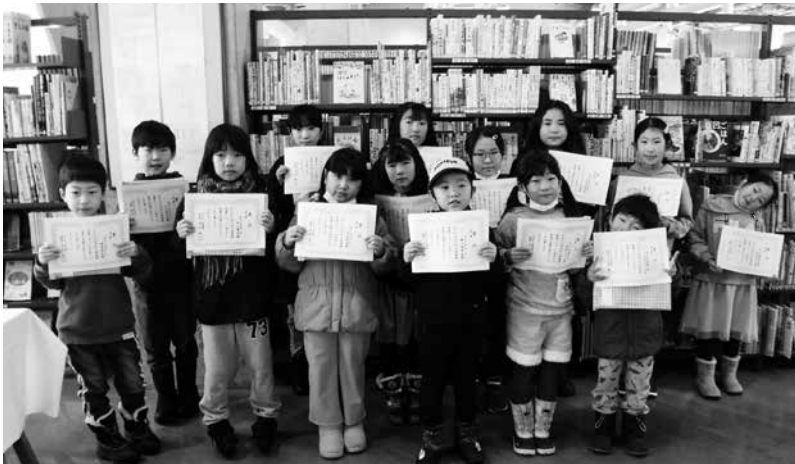
読書マラソン表彰式