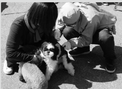
(写真5) 狂犬病予防注射の様子

第1弾となった今回は5月12日から15日までの4日間行われ、約650件の利用がありました。利用者の中にはお米や旬の山菜のほか、町の特産品である「タッココーラ」を送っている方