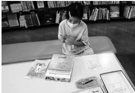
読書マラソンはじまるよ!