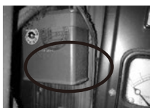
低圧進相コンデンサー