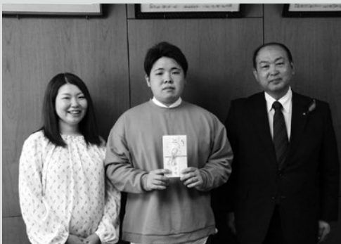
(写真3)対象となった夫婦(5月10日)