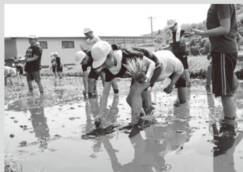
(写真9) 田植え体験の様子 (田子小)