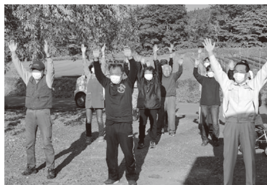
自治会チャレンジ（柴倉）