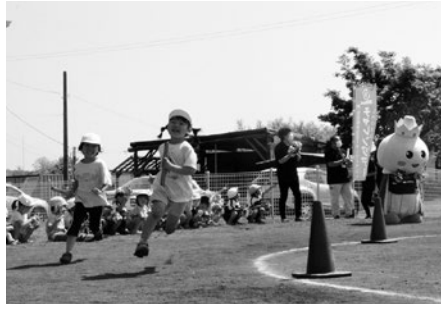
王子にチャレンジ (たっここども園)