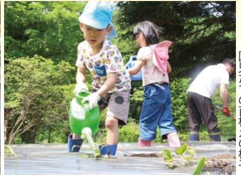
園児たちの苗植えの様子

あげました。今回植えられた野菜は収穫の後、園児たちのおやつに加工されるほか、秋に行われる焼き芋大会で振る舞われる予定です。