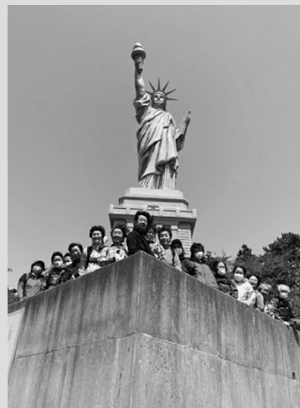
(写真1)自由の女神像で記念撮影