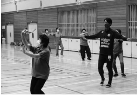
ファイナルセレモニー (ナニヤドヤラ)