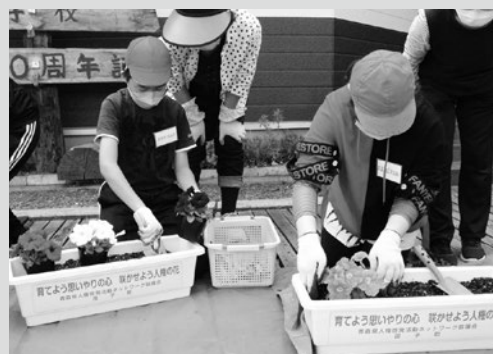
(写真4) 清水頭小学校での花植え