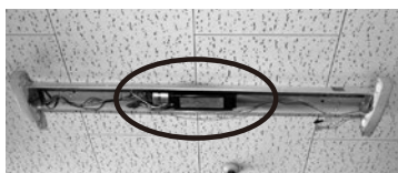
業務用照明器具安定器