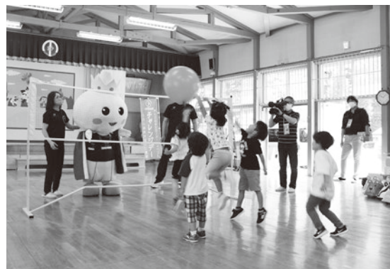
王子にチャレンジ（田子幼稚園）