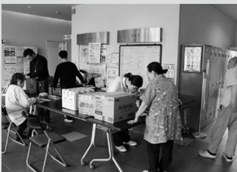
(写真7) 家族のきずな便受付の様子