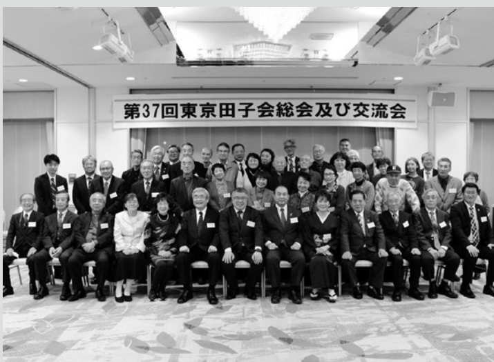
(写真9) 参加者で記念撮影