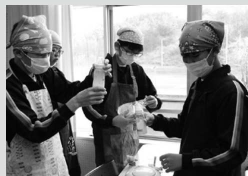
(写真8) ミルク作りの様子