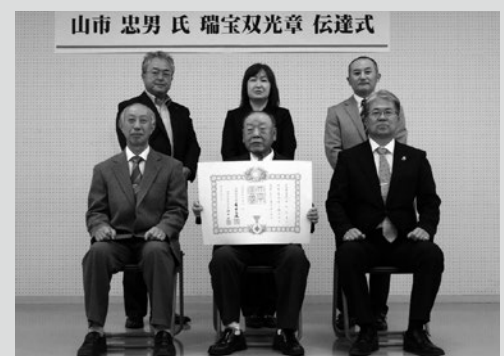
(写真7) 伝達式の様子

11月23日、東京都内で第 37回東京田子会総会及び交 流会が開催されました。 3年ぶりの開催に、町か らは、町長、副町長、教育 長、町議会議員のほか関係 職員が、関東近郊からは約 50名の田子出身者と来賓が 参加し、久しぶりの再会を 喜びました。 総会では、議案審議の他、 町の話題として、今年、田 子町のにんにくが生産開始 60年を迎えたことが紹介さ れました。また、交流会で は、にんにく加工品等の特 産品が当たる抽選会も行わ れ、JA八戸田子町直売部 会の方が作った「串餅」 「なべっこ団子」「煮しめ」 等の郷土料理がお土産とし て配られました。