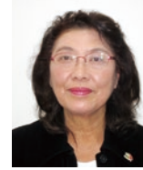
池田 良 種子・野々上・池振・野畦沢・川向