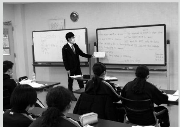
(写真1) 高校受験対策講座の様子