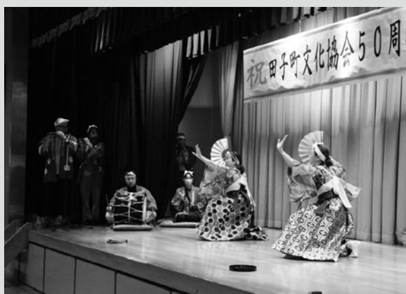
(写真6)記念公演での田子神楽保存会による演技披露