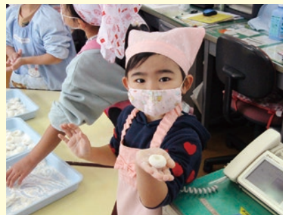
上手にお団子できたよ

おしるこのお団子作りでは園児全員で挑戦し、「ぼくのお団子大きくてかっこいい」や「私の方が大きい」などと競い合いながら、上手にお団子を丸めていました。