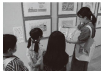
学芸員による展覧会の案内