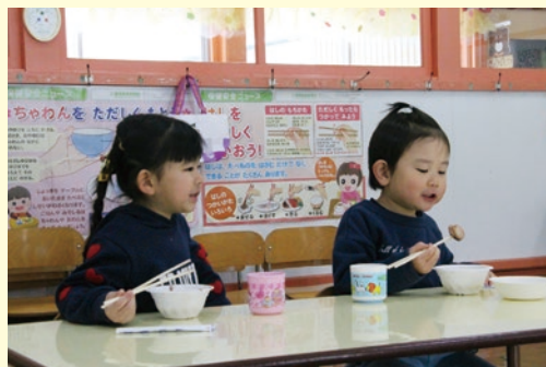
おしるこおいしいな

また、この日は幼稚園のキッズデイ(小学生の預かり保育)があり、参加した児童にもおしるこが振る舞われ、一緒に季節の味を楽しみました。