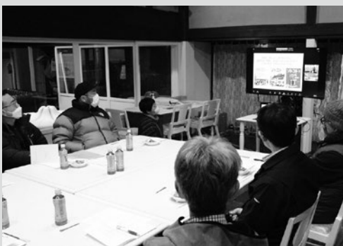
(写真3) ビジネスナイトの様子