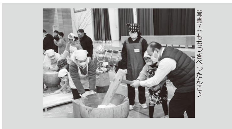
(写真)もちつきべったんこ

「ほのぼのタイム」では、カルタやこま回し、お手玉などの昔あそびで保護者や地域の方々とふれあい、その後の会食では、あんこや練りゴマ、雑煮等にしてお餅を食べました。 最後に、出町校長から児童たちに向けて「今回のもちつき大会は43回目です。皆さんが大人になって地域の皆さんと一緒に44回目のもちつき大会を開催してくれれば私もぜひ参加したい」と熱いメッセージを送っていました。