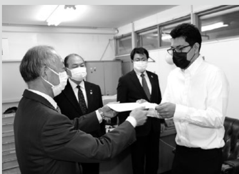
(写真5)一戸教育委員から辞令を手渡されるクリスさん(右)