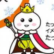
たっこにんにく イメージキャラクター たっこ王子